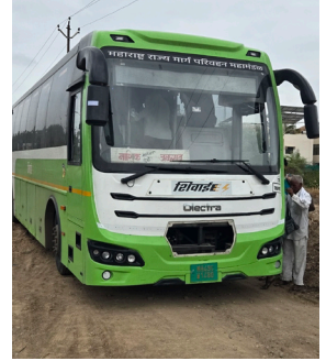
नियोजन केले. त्यानुसार नाशिकहून जळगावकडे जाणारी एमएच ४९/सिटी-१४८० क्रमांकाची इलेक्ट्रिक बस डोंगरे महाराज नगरमार्गे वरखेडी रोडकडे वळविण्यात आली. मात्र, त्या मार्गावर डमिंगमधील कचरा,

धुळे, दि. ३० - धुळे शहरातील कृषी उत्पन्न बाजार समिती परिसरात मंगळवारी आठवडी बाजारामुळे मोठी गर्दी झाल्याने सकाळपासून वाहतुकीची कोंडी झाली. बाजार समितीपासून पुढील परिसरापर्यंत तसेच चौफुली ते मार्केटपर्यंत दोन्ही बाजूंनी वाहनांच्या लांबच लांब रांगा लागल्याने वाहतुकीस मोठा अडथळा निर्माण झाला. जेसीबी यंत्राच्या सहाय्याने अखेर बस बाहेर काढण्यात आली. बस आडकटल्याची खबर मिळताच वाहतूक सुळीत करण्यासाठी वाहतूक पोलिसांनी पर्यायी मार्गाचा वापर करण्याचे