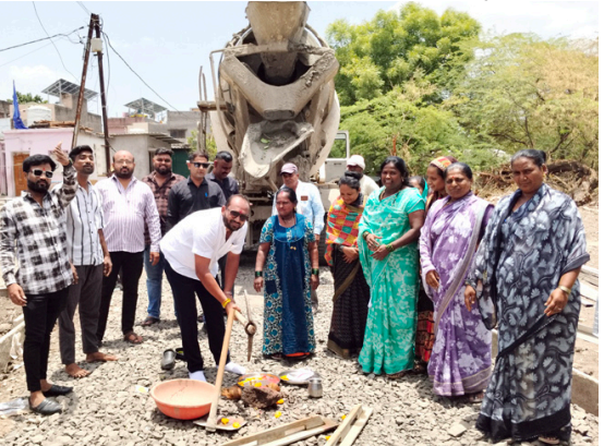
पावसाळ्यातील समस्यांपासून भावना उपस्थित नागरिकांनी व्यक्त मोठा दिलासा मिळणार असल्याची केली.