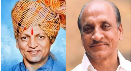
मा.मंत्री डॉ. पद्मसिंह पाटील यांच्यासह सर्व निर्दोष