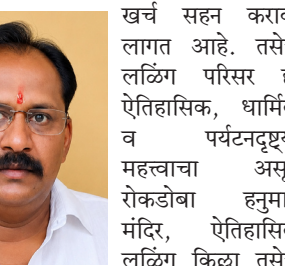
डॉ. बाबासाहेब आंबेडकर यांच्या

वाढत्या विस्तारामुळे लडिंग, अवधान, जुन्नर, मोरशेवडी, सडावा, आवी, हेडून, मोघन, धाडरे आदी गावांतील नागरिक, शेतकरी, व्यापारी, विद्यार्थी व कर्मचारी यांचा शहराशी दैनंदिन संपर्क वाढला आहे. मात्र टोल प्लाझामुळे स्थानिक वाहनधारकांना वारंवार टोल भरावा लागत असून आर्थिक भुईद, वाहतूक कोंडी, वेळेचा अपव्यय व इंधनाचा अतिरिक्त