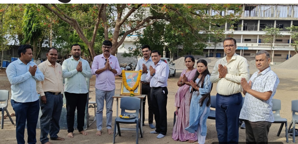
अर्पण केली. यावेळी त्यांच्या स्वातंत्र्यलढ्यातील योगदान, आदिवासी समाजाच्या हक्कांसाठी केलेला संघर्ष आणि अन्यायाविरुद्ध उभारलेला लढा

शिरपूर, दि.११- महान आदिवासी क्रांतिवीर, जननायक आणि स्वातंत्र्यलढ्यातील प्रेरणादायी व्यक्तिमत्त्व भगवान बिरसा मुंडा यांच्या बलिदान दिनानिमित्त शिरपूर तालुक्यातील वाघाडी येथील आर. सी. पटेल अनुदानित प्राथमिक, माध्यमिक व उच्च माध्यमिक आश्रमशाळेत अभिवादन कार्यक्रम उत्सव-हार्णूण वातावरणात संपन्न झाला. विद्यार्थ्यांमध्ये राष्ट्रप्रेम, सामाजिक बांधिलकी आणि इतिहासाविषयी जागरूकता निर्माण करण्याच्या उद्देशाने या कार्यक्रमाचे आयोजन करण्यात आले.