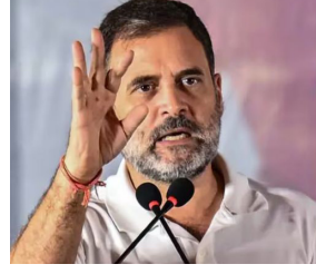
राहुल गांधी यांनी उद्योगपती गौतम अदानी आणि मुकेश अंबानी यांचा उल्लेख करत केंद्र सरकारची आर्थिक धोरणे काही निवडक उद्योगपतींना लाभ देण्याचा आरोप केला. या धोरणांचा सर्वाधिक फटका उतर प्रदेशातील युवक, शेतकरी, मजूर आणि छोटीया व्यावसायिकांना बसणार असल्याचे त्यांनी सांगितले.

रायबरेली दौऱ्यावर बोलताना राहुल गांधी म्हणाले की, सध्याची आर्थिक व्यवस्था मोजक्या उद्योगपतींच्या फायद्यासाठी आहे. ही व्यवस्था जास्त काळ टिकणार नाही. पण, सध्या या व्यवस्थेमुळे लवकरच देशाला मोठा आर्थिक धक्का बसू शकतो. जो आर्थिक झटका बसणार आहे त्याचा परिणाम उद्योगपतींवर होणार नाही, तर सामान्य नागरिकांवर होणार आहे. अदानी-अंबानींच्या लाभाची व्यवस्था राहुल गांधी यांनी उद्योगपती गौतम अदानी आणि मुकेश अंबानी