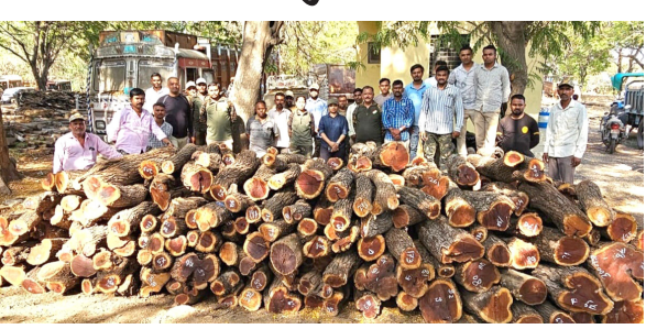
कोंडाईबारी घाटातील वनउपज तपासणी नाका चौकीवर संशयित ट्रक क्रमांक जीजे १७/एक्सएक्स-१९५५ थांबवून तपासणी करण्यात आली. तपासणीदरम्यान ट्रकमध्ये मोठ्या प्रमाणात खैर लाकूड आढळून आले. वाहतूक कागदपत्रांची चौकशी केली असता चालकाने तेलंगणा राज्य येथील परवानगीपत्र सादर केले. मात्र संबंधित ऑनलाईन पडताळणी करताना (पान ४ वर)

नवापूर, दि. १७ प्रतिनिधी- नवापूर तालुक्यातील कोंडाईबारी घाट परिसरात वनविभागाने मोठी कारवाई करत बनावट परवान्याच्या आधारे सुरू असलेली खैर लाकडाची वाहतूक उघडकीस आणली. या कारवाईत तब्बल अठ्ठावीस लाख पंचवीस हजार एकशे चोवीस किमतीचा खैर लाकूड माल आणि ट्रक जप्त करण्यात आला.