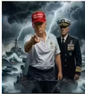
पडत आहे. परिणामी, ट्रम्प यांच्या या पोस्टमुळे अमेरिका आणि इझ्रायल इराणविरुद्ध (पान ४ वर)