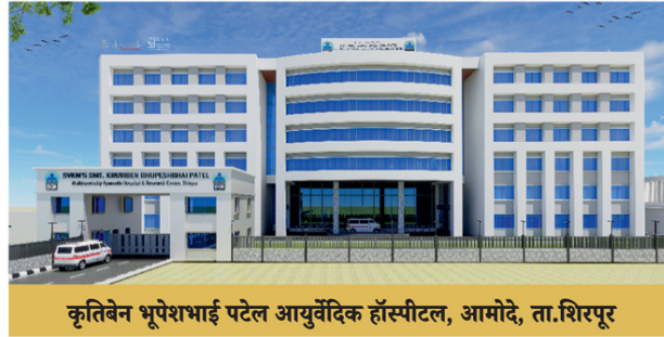
कृतिवेन भूपेशभाई पटेल आयुर्वेदिक हॉस्पिटल, आमोदे, ता.शिरपूर