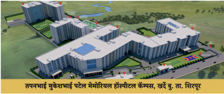
तपनभाई मुकेशभाई पटेल मेमोरियल हॉस्पिटल कॅम्पस, खर्दे बु. ता. शिरपूर

आर.सी. पटेल फार्मसी कॉलेज ग्राऊंड, करवंद नाका, शिरपूर जि. धुळे