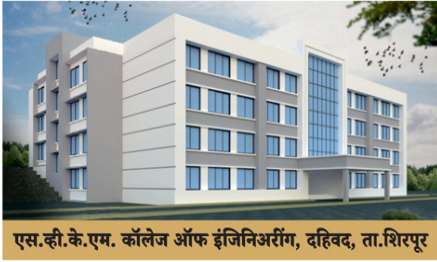
एस.व्ही.के.एम. कॉलेज ऑफ इंजिनिअरिंग, दहिवद, ता.शिरपूर