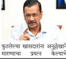
फुटलेल्या खासदारांना अनुल्लेखाने मारण्याचा प्रयत्न केल्याचे

आपचे राष्ट्रीय संयोजक अरविंद केजरीवाल यांनी पक्षाच्या फुटलेल्या खासदारांचा प्रतिक्रियेत कुठेही उल्लेख केला नाही. केजरीवालांच्या पोस्टमध्ये भाजप आणि पंजाबचा उल्लेख आहे. भाजपने पंजाबला पुन्हा धोका दिला, असे म्हणत केजरीवालांनी