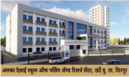
अलका देसाई स्कूल ऑफ नर्सिंग अँड रिसर्च सेंटर, खर्दे बु. ता. शिरपूर