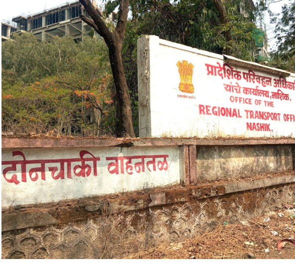
नाशिक परिवहन कार्यालयात शांतता नित्य गजबजणारे प्रादेशिक परिवहन कार्यालय ४० कर्मचाऱ्यांनी बेमुदत बंदच्या संपात भाग घेतल्यामुळे बुधवारी (२२) कार्याची कामकाज पूर्णपणे ठप्प झाले होते यामुळे परवाना वाहन नोंदणी आणि कार भरण्यासाठी आलेल्या नागरिकांना मोठा फटका बसला बाहेरच थांबून कार्यालयात शुक्रशुक्राट पाहून सर्व नाराजीने निघून गेले. इतर सरकारी कार्यालयांमध्येही संपामुळे शुक्रशुक्राट पसरलेला होता.