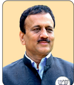
मा.ना.श्री. गिरीश महाजन (मंत्री, जलसंपदा : विदर्भ, तापी व कोकण खोरे विकास महामंडळ, आपत्ती व्यवस्थापन)