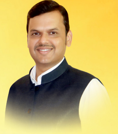
मा.ना.श्री. देवेंद्र फडणवीस साहेब (मुख्यमंत्री, महाराष्ट्र राज्य)