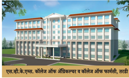
एस.व्ही.के.एम. कॉलेज ऑफ अॅग्रिकल्चर व कॉलेज ऑफ फार्मसी, तरडी