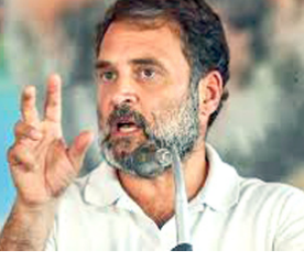
१६ लाख कोटी रुपये म्हणजे मनरेगेचे पंचवीस वर्षाचे बजेट असल्याचा देखील आरोप राहुल गांधी यांनी केला आहे. म्हणजेच पंचवीस वर्षाचा (पान ४ वर)